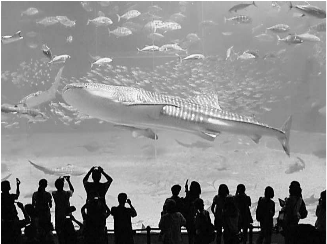
沖縄美ら海水族館（2009年6月24日撮影）