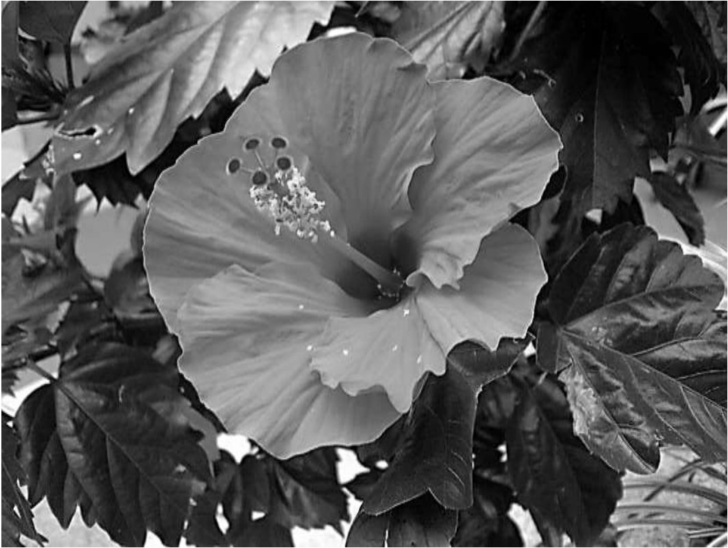
ハイビスカス（2007年7月3日撮影）