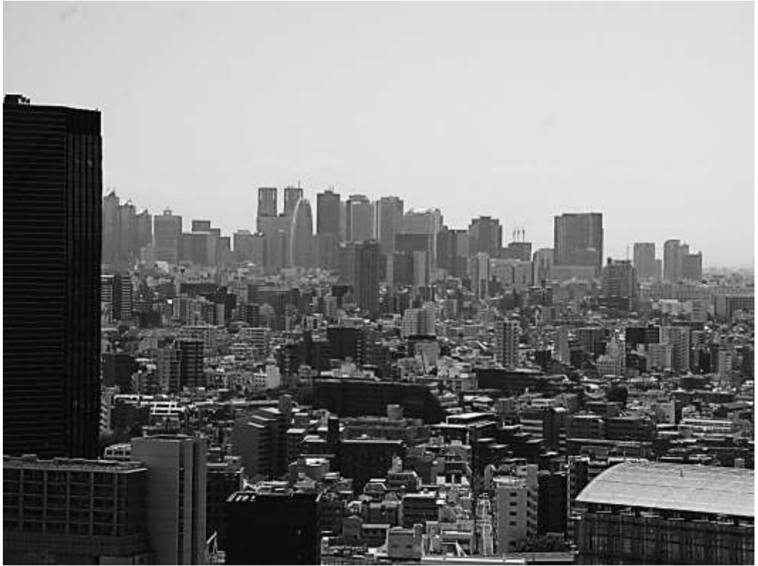
コンクリートジャングル（2016年6月3日撮影）