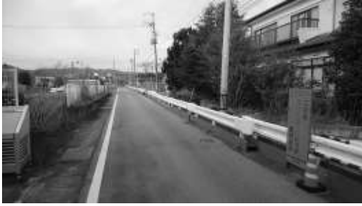
↑ガードレールの右側が帰宅困難地域です。このガードレール、道路一本が大きな境界線です

ティアとして何かをしなくても、 現場に行つて現場の人の話を聞く。 それが必要とされていたことで、 そしてこれからも必要なことなん だと改めて感じました。 これからの活動内容がどのよう になるか分かりませんが、この活 動が細くても長くつながるよう にしたいと思っています。今回の交