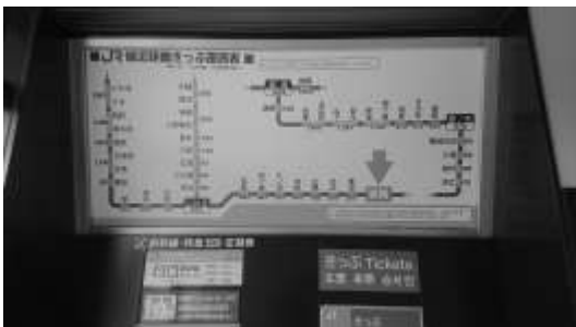
↑富岡駅～浪江駅（常磐線）繋がらない電車

目に富岡町をご案内いただくこと が決まり行つてきました。帰宅困 難地域と避難指示解除準備区域の 境界線や、仮設住宅に住まわれて いた方が以前住まわれていた場 所、震災直後に避難した場所、富 岡町に戻つて再開したお蕎麦屋さ ん、東京電力廃炉資料館（旧エネ ルギー館）、一般廃棄物最終処分