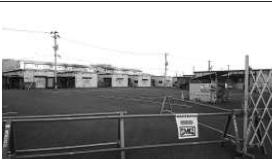
↑ 閉鎖された仮設住宅