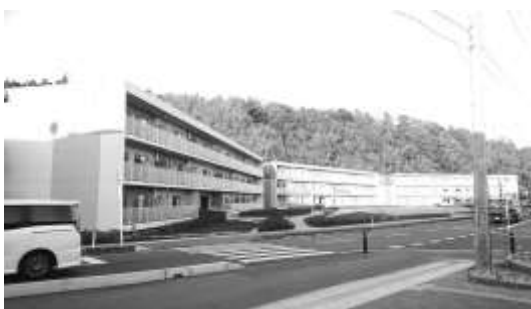
↓ さまざまな仮設住宅から集められた復興住宅

れは初めて好間仮設で話を伺った時の感覚です。あの時もそうでした。「ご近所さんには話せない。あなたたちが来てくれるから話せる」と。近い所、近い人には話しづらいことも、ある意味「他人」には話せる。話すことよって気持ちの整理ができたり、気持ちたちが楽になったりする。僕たちがボラン