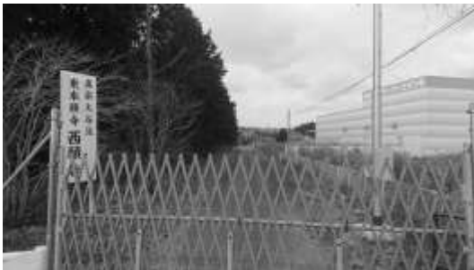
↑帰宅困難地域内にある西願寺 (仙台教区浜組)