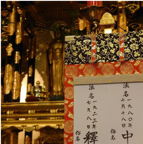
honmyouji271 【住職日記】2022-06-25 門徒さんの #百回忌 をお勤めました🙏 #グリーフの多い #法事 の中で 施主さんが勤められたことの慶びを語られ あらためてご法事を勤めることの意味を確認させていただきました😊 #真宗大谷派 #本明寺 #南無阿弥陀仏